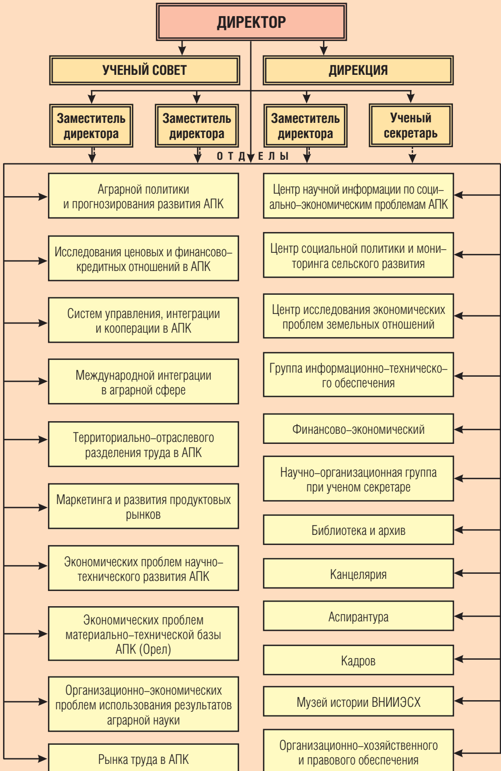
Организационная структура Всероссийского научно-исследовательского института экономики сельского хозяйства